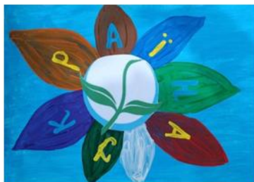
Іванок Л. «Український зелений журавлик»