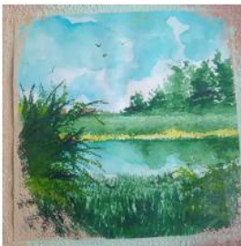
Петрик Ліза «Чиста планета»